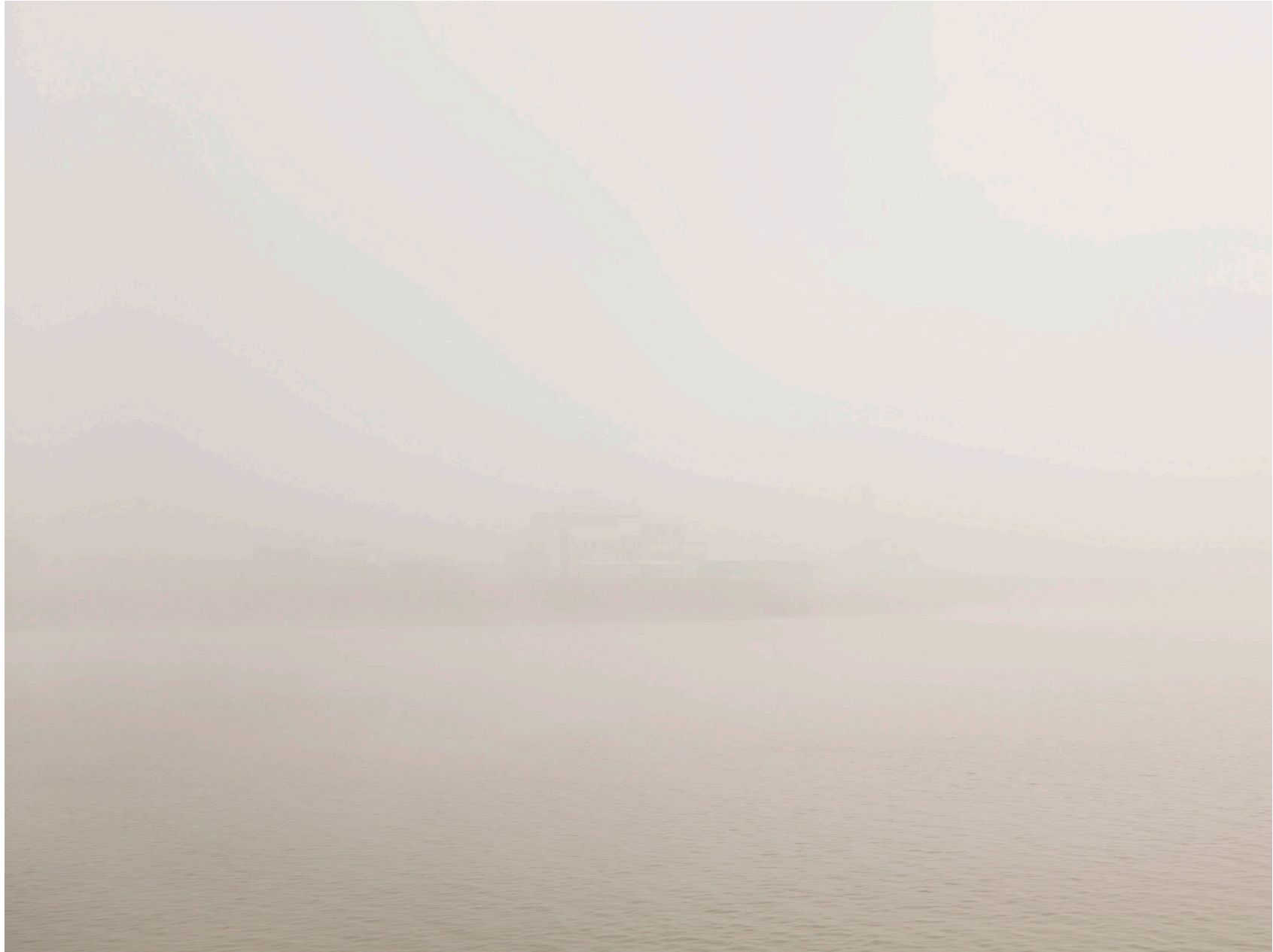
Thames #06 (London 2008)

Impresión de tinta sobre papel de algodón – 116 x 146 cm (imagen 90 x 120 cm) Archival pigment print on cotton paper – 45 11/16 x 57 1/2 in (image 35 x 46 3/4 in) Ed. 3 + 2ap