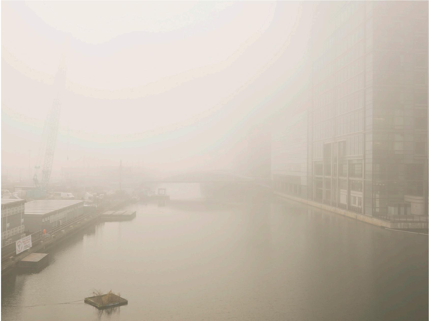
Thames #03 (London 2008)

Impresión de tinta sobre papel de algodón - 150 x 190 cm (imagen 120 x 160 cm) Archival pigment print on cotton paper - 59 x 74 ¾ in (image 46 ¾ x 62 3/8 in) Ed. 3 + 2ap