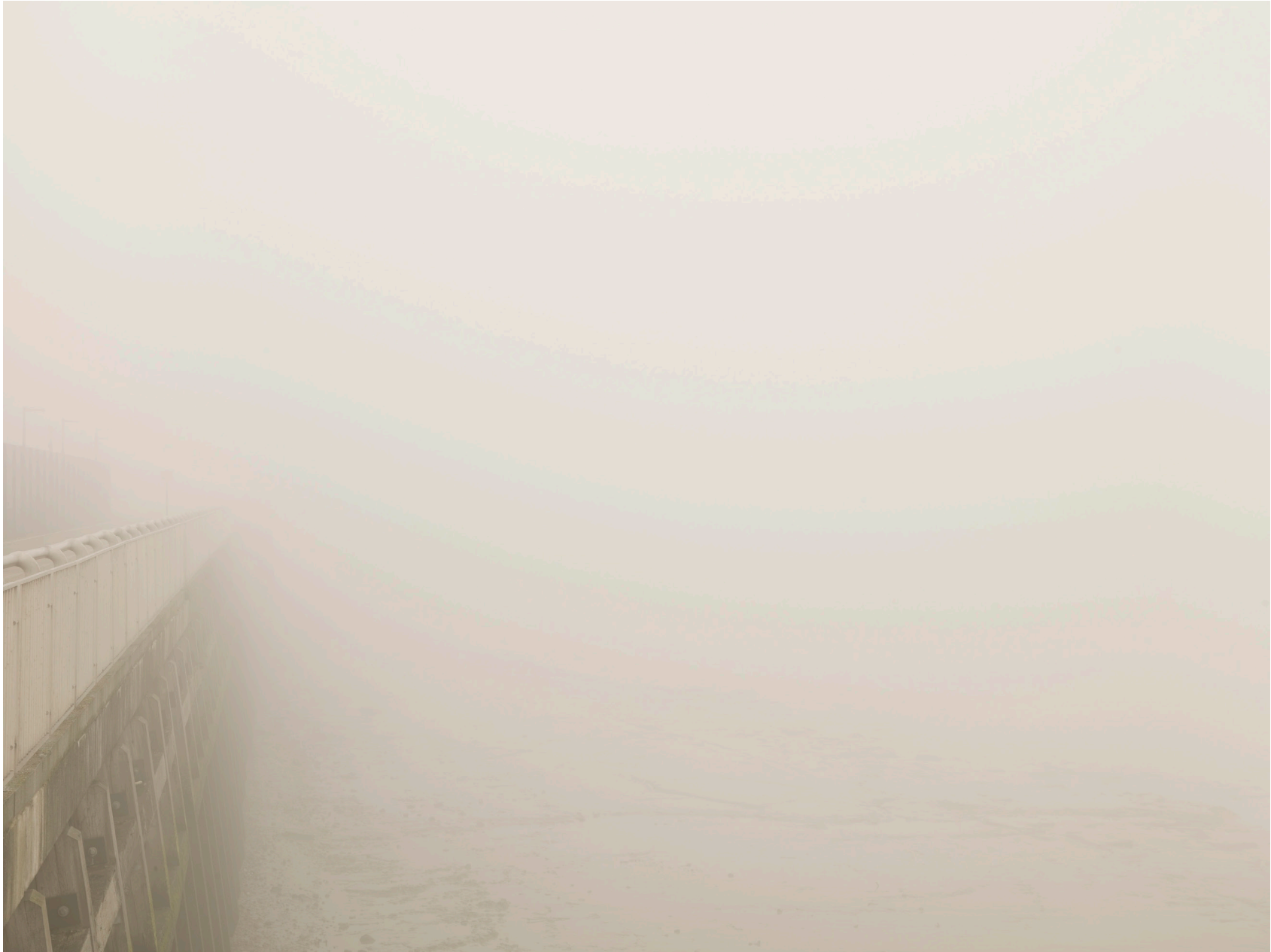
Thames #19 (London 2008)

Impresión de tinta sobre papel de algodón – 116 x 146 cm (imagen 90 x 120 cm) Archival pigment print on cotton paper – 45 11/16 x 57 1/2 in (image 35 x 46 3/4 in) Ed. 3 + 2ap