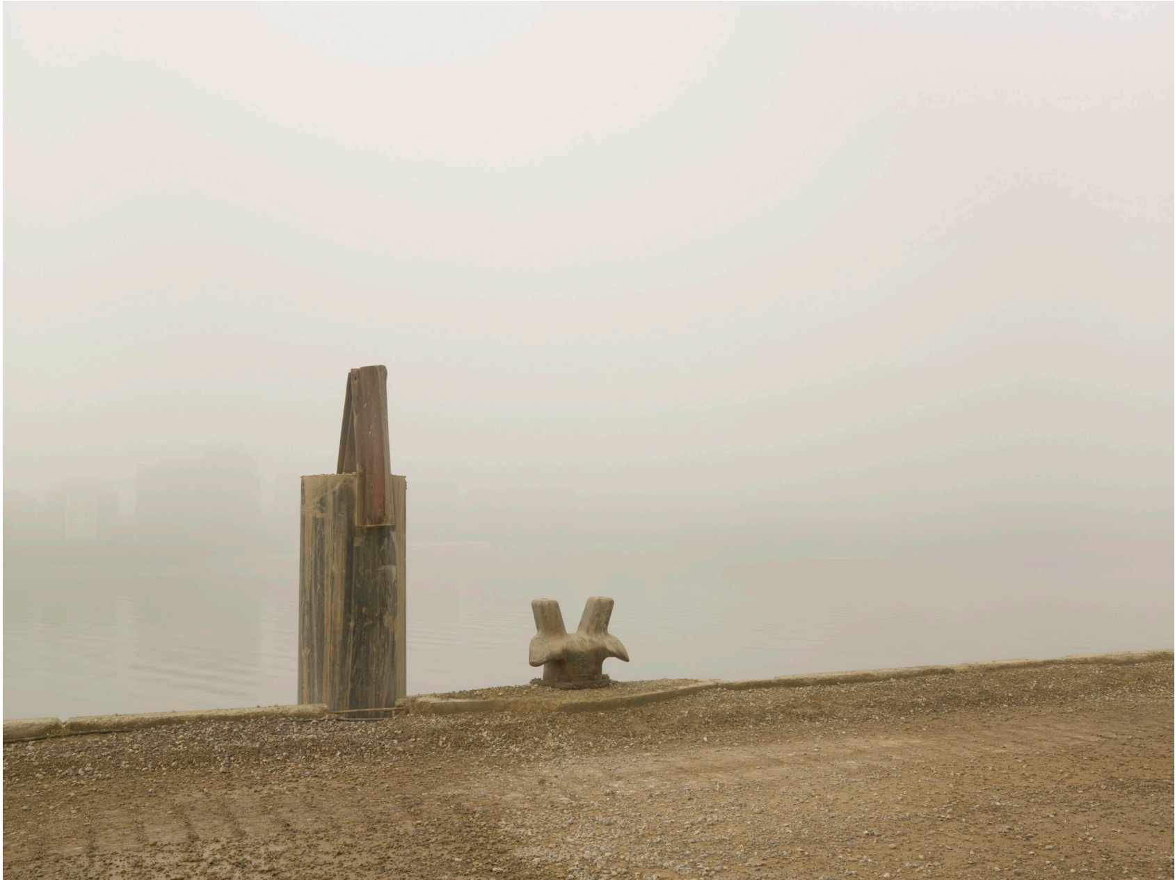
Thames #02 (London 2008)

Impresión de tinta sobre papel de algodón - 85 x 105 cm (imagen 60 x 80 cm) Archival pigment print on cotton paper - 33 ¼ x 41 in (image 23 3/8 x 31 ½ in) Ed. 3 + 2ap