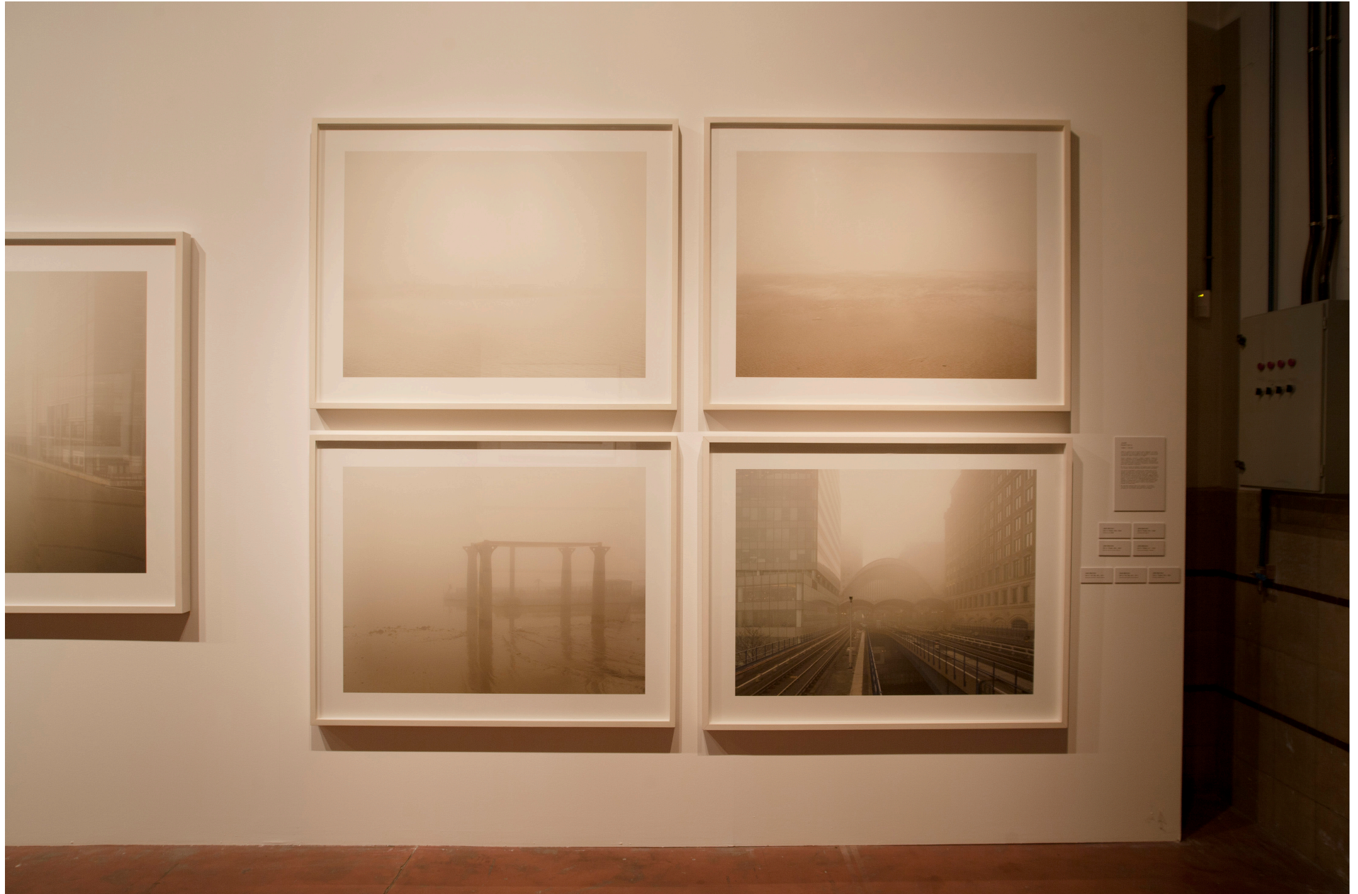
THAMES Installation View / Vista Exposición