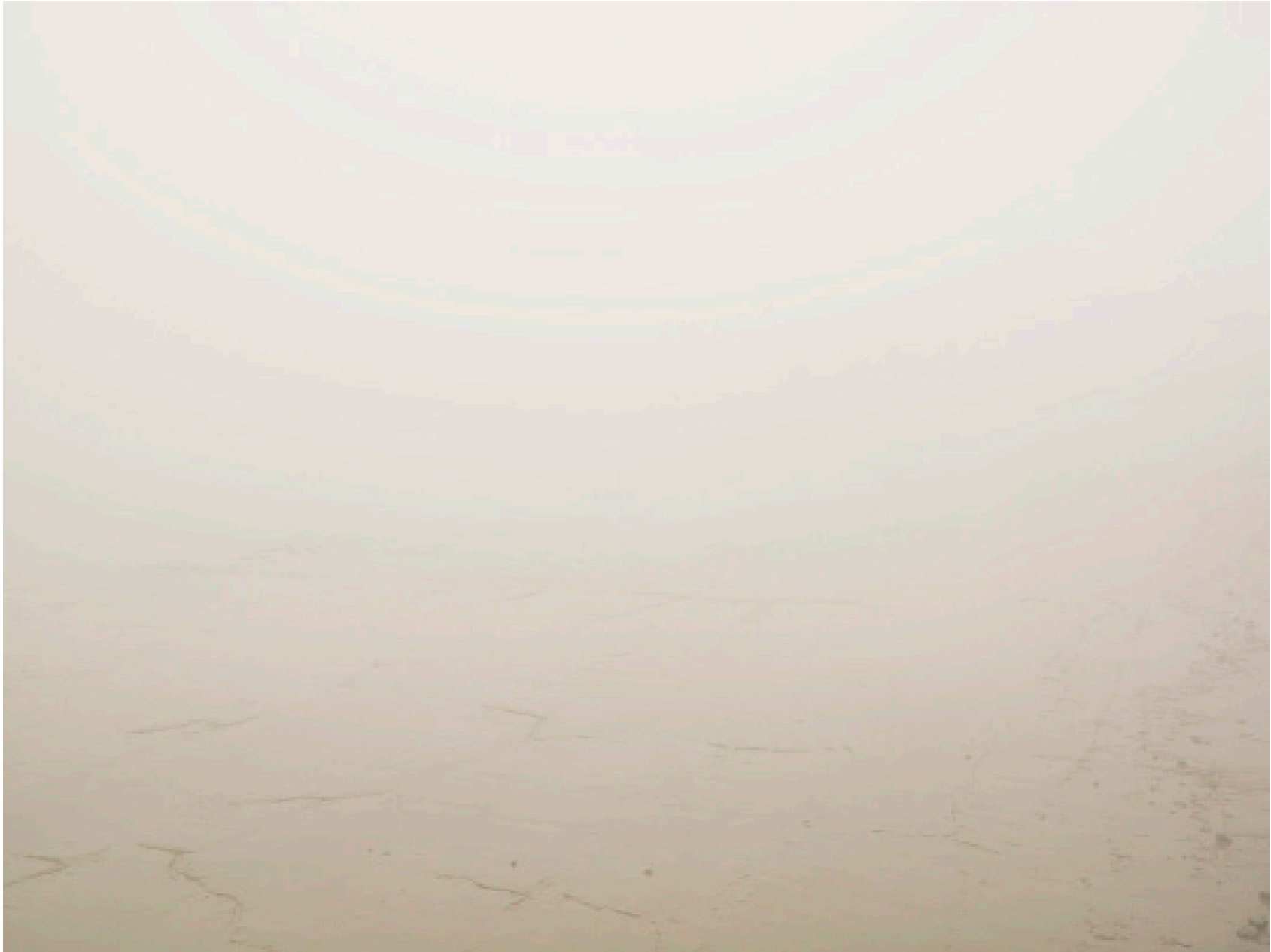
Thames #22 (London 2008)

Impresión de tinta sobre papel de algodón – 116 x 146 cm (imagen 90 x 120 cm) Archival pigment print on cotton paper – 45 11/16 x 57 1/2 in (image 35 x 46 3/4 in) Ed. 3 + 2ap