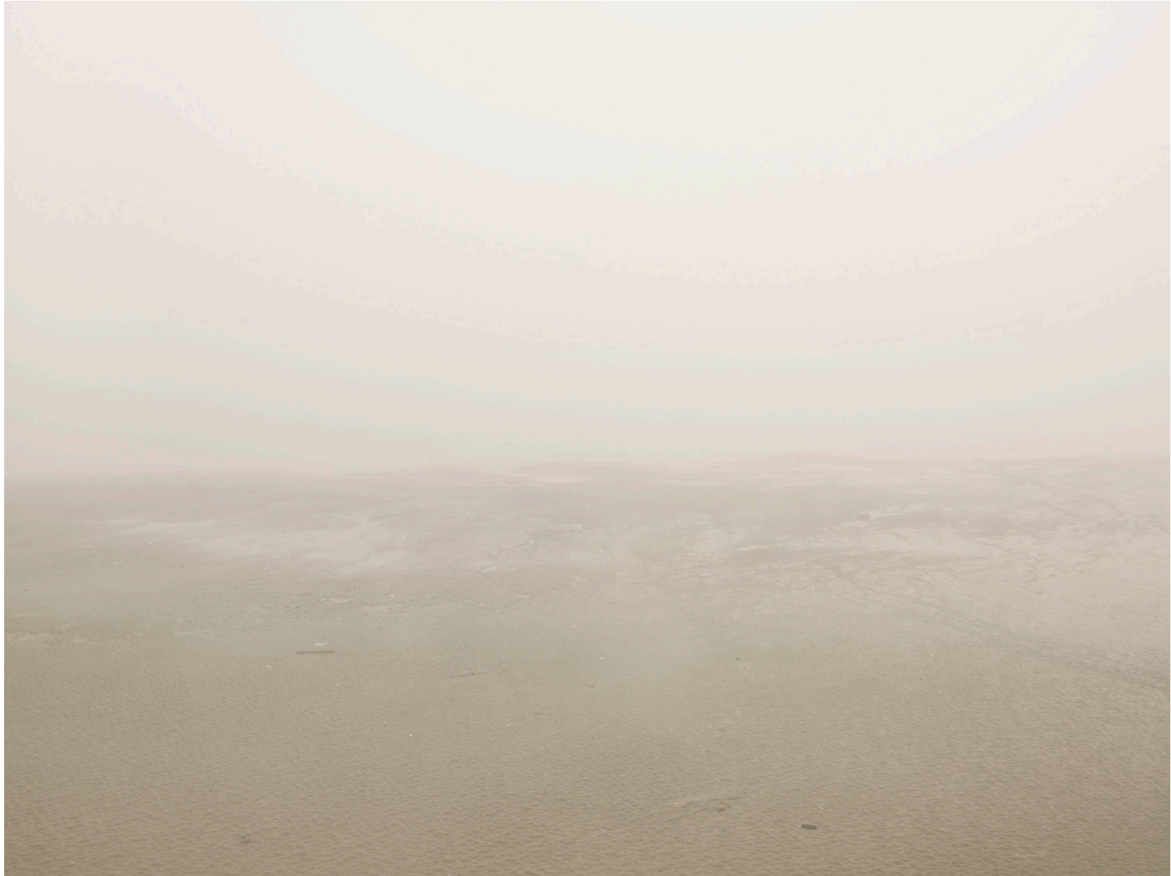
Thames #01 (London 2008)

Impresión de tinta sobre papel de algodón – 116 x 146 cm (imagen 90 x 120 cm) Archival pigment print on cotton paper – 45 11/16 x 57 1/2 in (image 35 x 46 3/4 in) Ed. 3 + 2ap