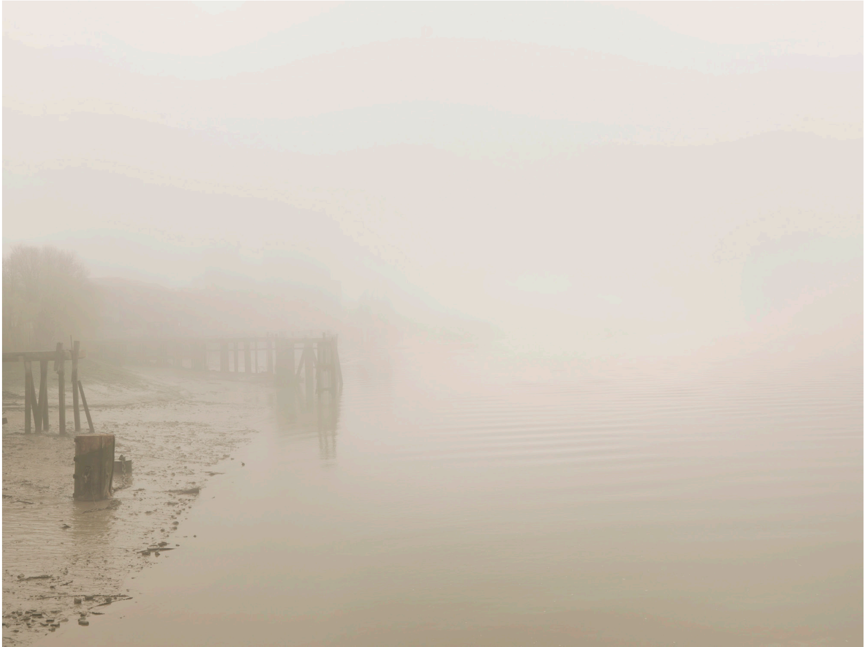
Thames #07 (London 2008)

Impresión de tinta sobre papel de algodón – 116 x 146 cm (imagen 90 x 120 cm) Archival pigment print on cotton paper – 45 11/16 x 57 1/2 in (image 35 x 46 3/4 in) Ed. 3 + 2ap