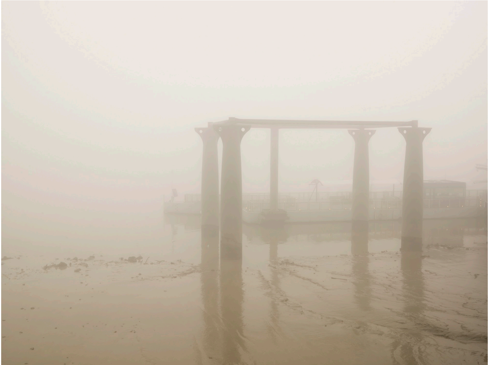
Thames #09 (London 2008)

Impresión de tinta sobre papel de algodón – 116 x 146 cm (imagen 90 x 120 cm) Archival pigment print on cotton paper – 45 11/16 x 57 1/2 in (image 35 x 46 3/4 in) Ed. 3 + 2ap