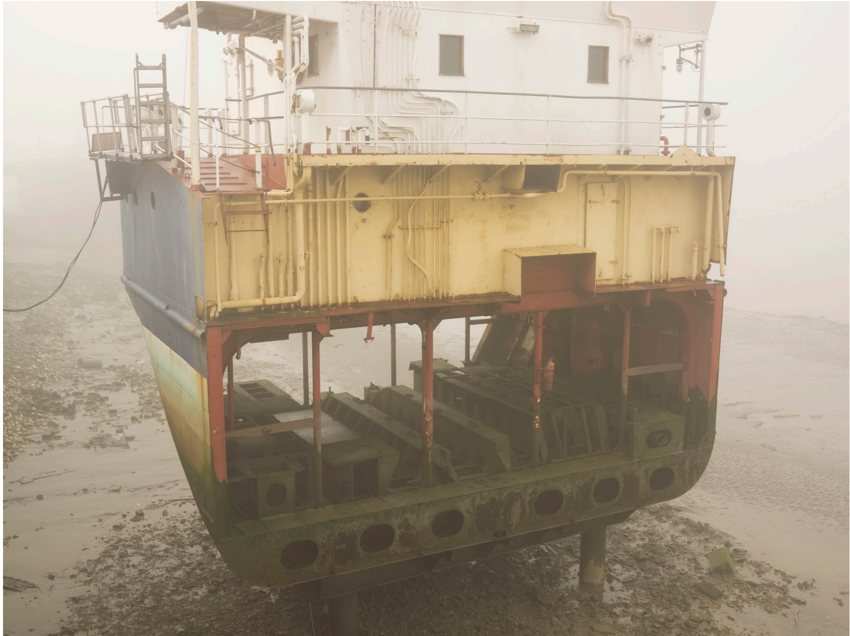
Thames #04 (London 2008)

Impresión de tinta sobre papel de algodón - 85 x 105 cm (imagen 60 x 80 cm) Archival pigment print on cotton paper - 33 3/8 x 41 in (image 23 3/8 x 31 1/2 in) Ed. 3 + 2ap