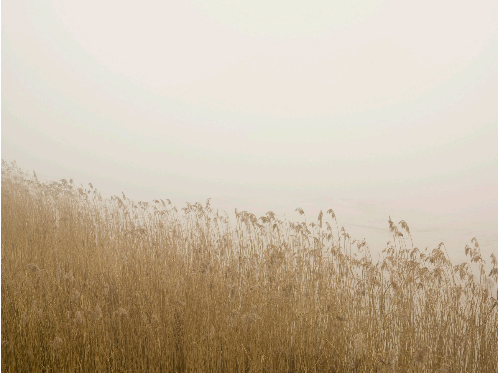
Thames #08 (London 2008)

Impresión de tinta sobre papel de algodón - 85 x 105 cm (imagen 60 x 80 cm) Archival pigment print on cotton paper - 33 ¼ x 41 in (image 23 3/8 x 31 ½ in) Ed. 3 + 2ap