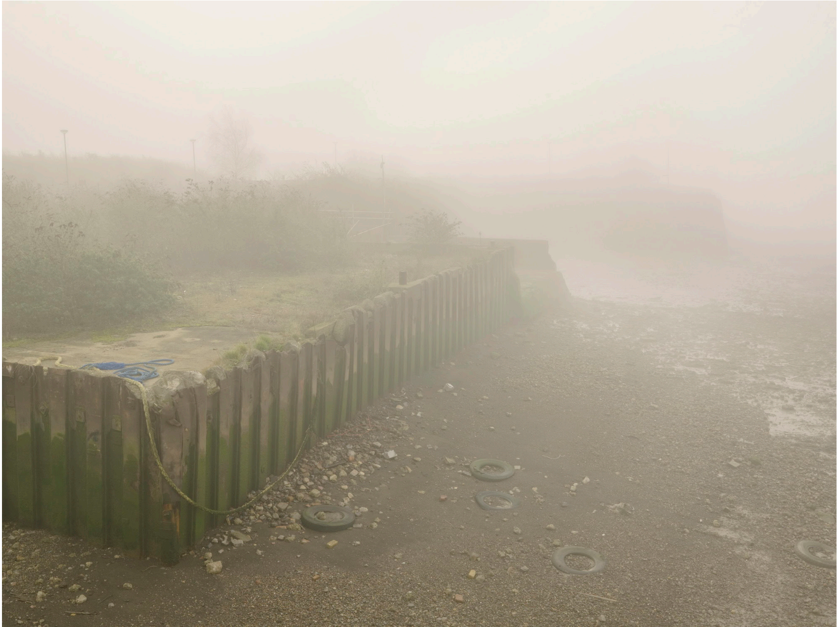
Thames #10 (London 2008)

Impresión de tinta sobre papel de algodón – 116 x 146 cm (imagen 90 x 120 cm) Archival pigment print on cotton paper – 45 11/16 x 57 1/2 in (image 35 x 46 3/4 in) Ed. 3 + 2ap