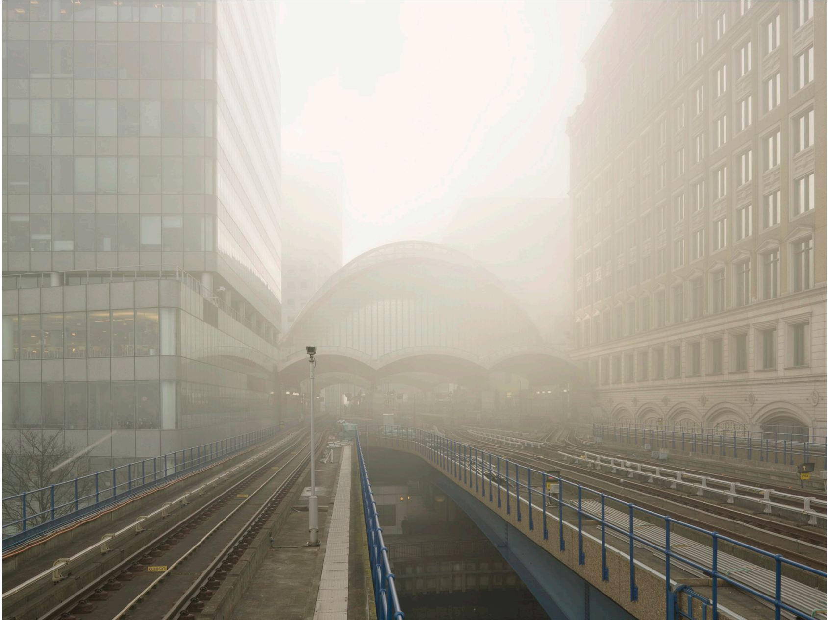
Thames #11 (London 2008)

Impresión de tinta sobre papel de algodón – 116 x 146 cm (imagen 90 x 120 cm) Archival pigment print on cotton paper – 45 11/16 x 57 1/2 in (image 35 x 46 3/4 in) Ed. 3 + 2ap