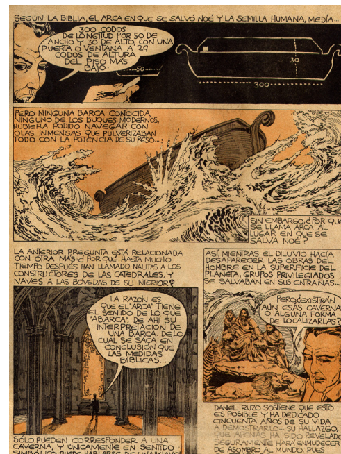
Nueve Copias Facsímiles de comics extraídos de una publicación de los años 60 procedentes del archivo de Daniel Ruzo de medidas 21 x 31 cm