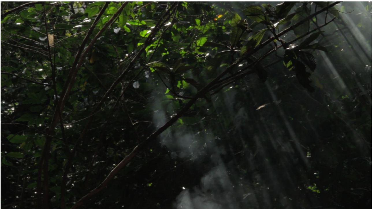
The Man Who Disappeared. (1st Chapter), 2011