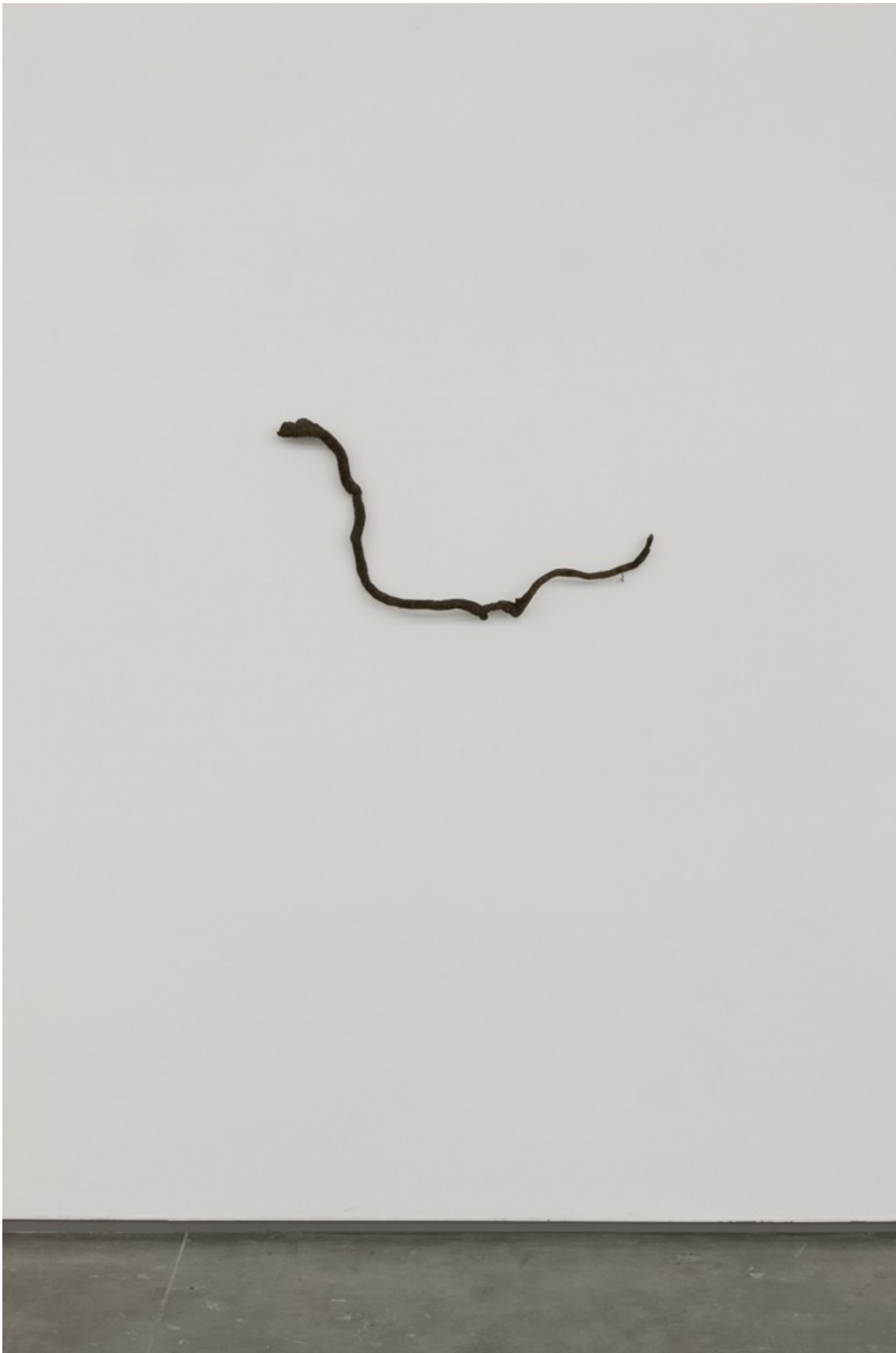
Holographic Capture. Tepoztlan, 2010 Wood