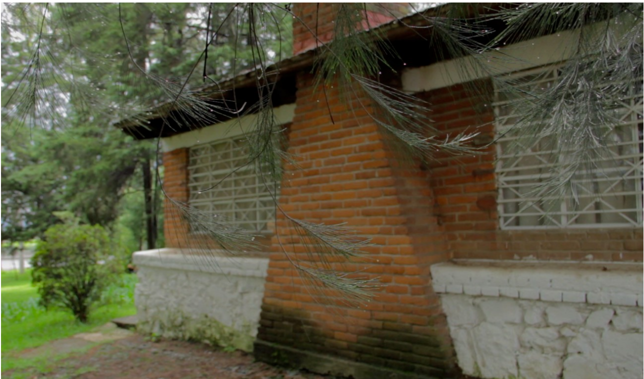
Fractal Access Totems , 2012 Video, 40: 11 min.

Spanish w/English Subtitles http://vimeo.com/60640870 password: regina