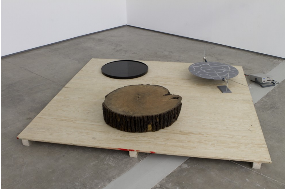
The Duration of the Present , 2012 Installation.

Un experimento en neurofisiología de Jacobo Grinberg-Zylberbaum que sugiere que la duración del presente puede expandirse o comprimirse según el estado de la consciencia.