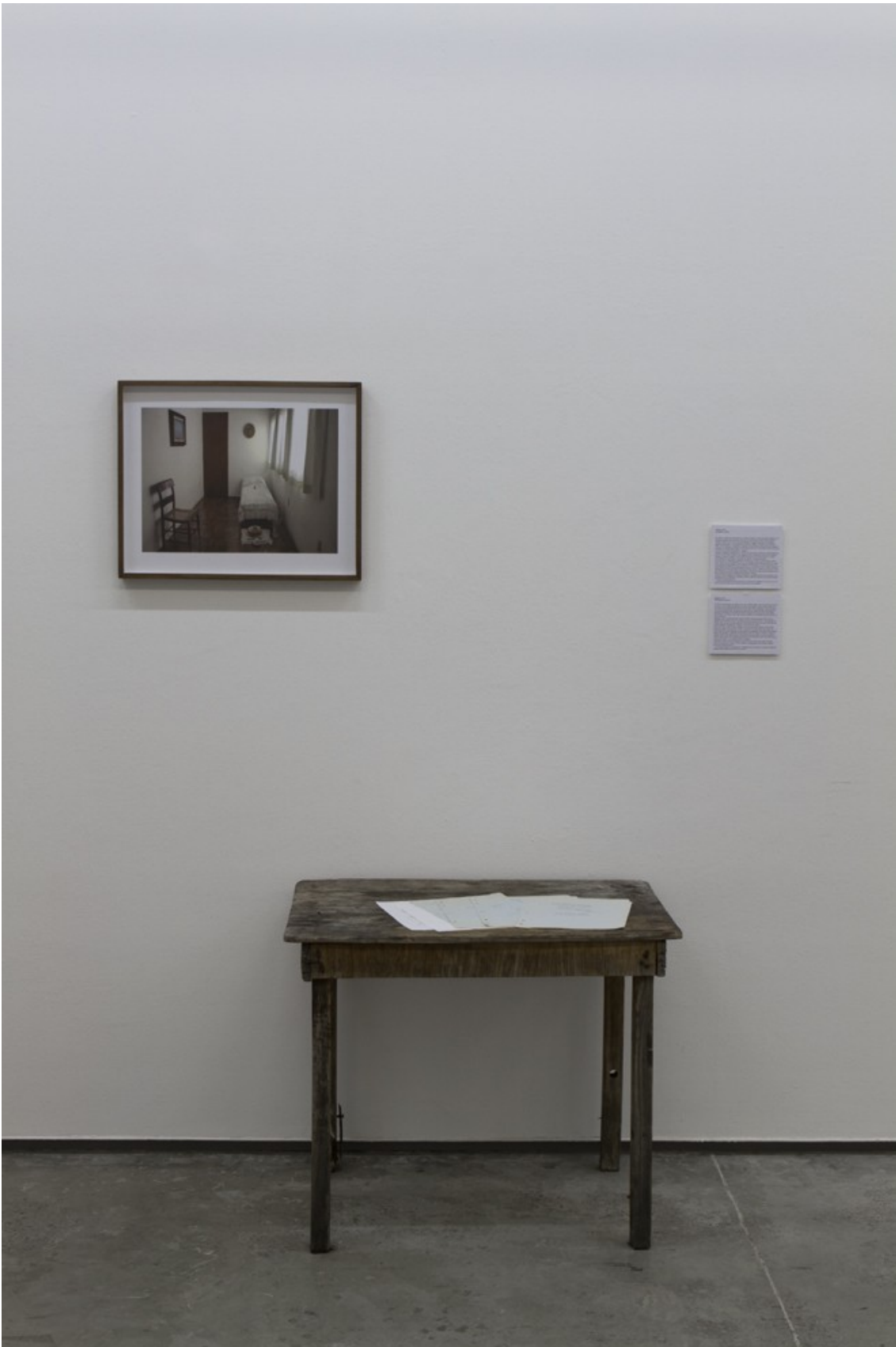
Eggor , 2012 Photograph and letters.