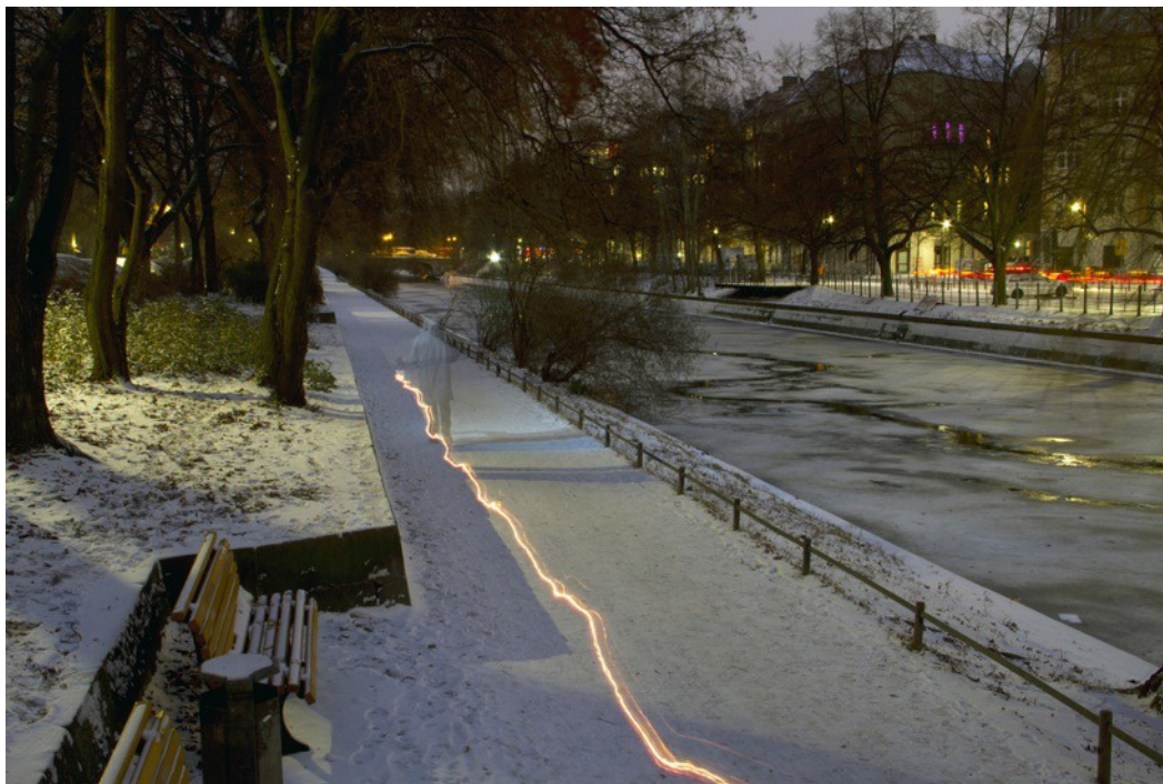
The Duration of the Present , 2013 Digital photograph 70 X 80 cm