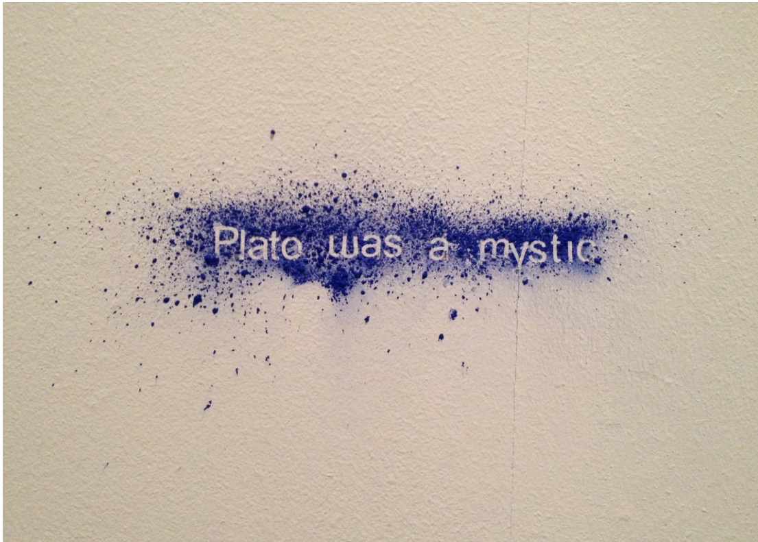
Plato was a Mystic, 2012 Pigmento azul sobre pared 20 cm aprox. Única

Plato was a Mystic, 2012 Blue pigment on wall 20 cm aprox.