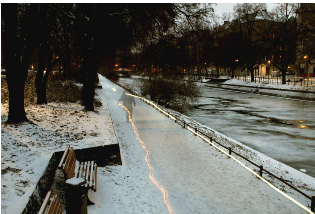
The Duration of the Present , 2013 Digital photograph 70 X 80 cm