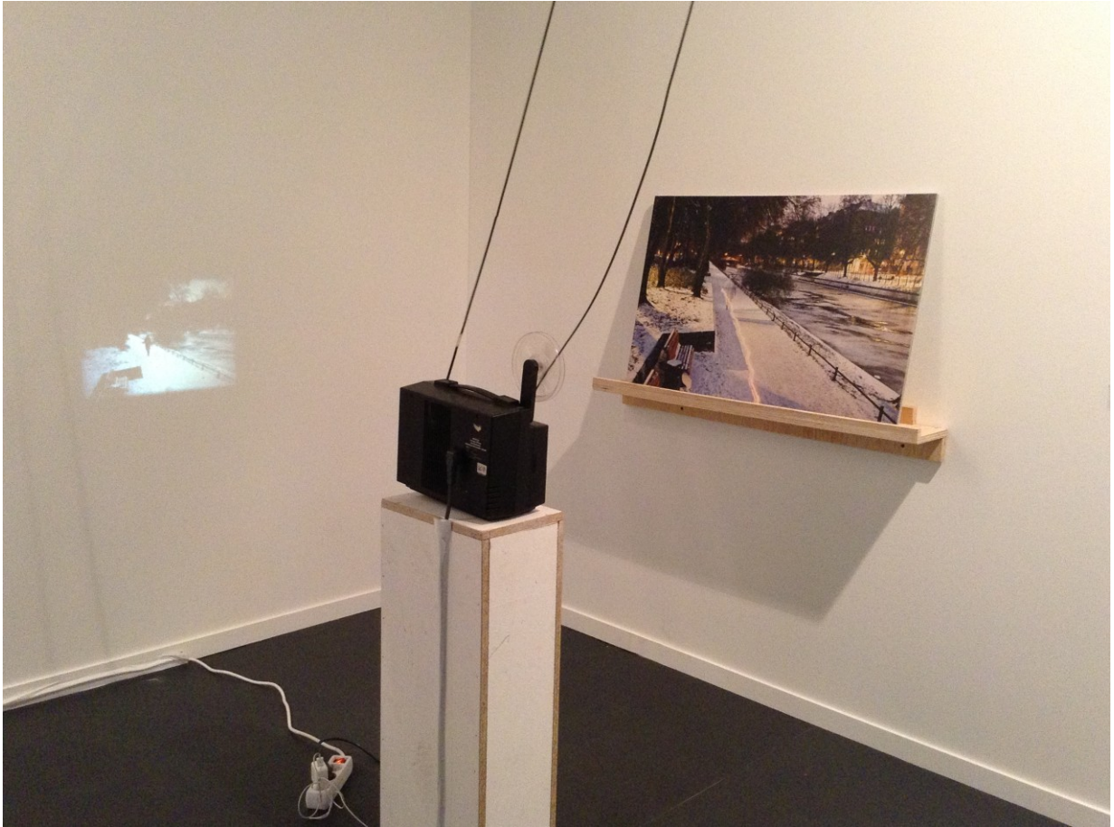
The Duration of the Present, 2012