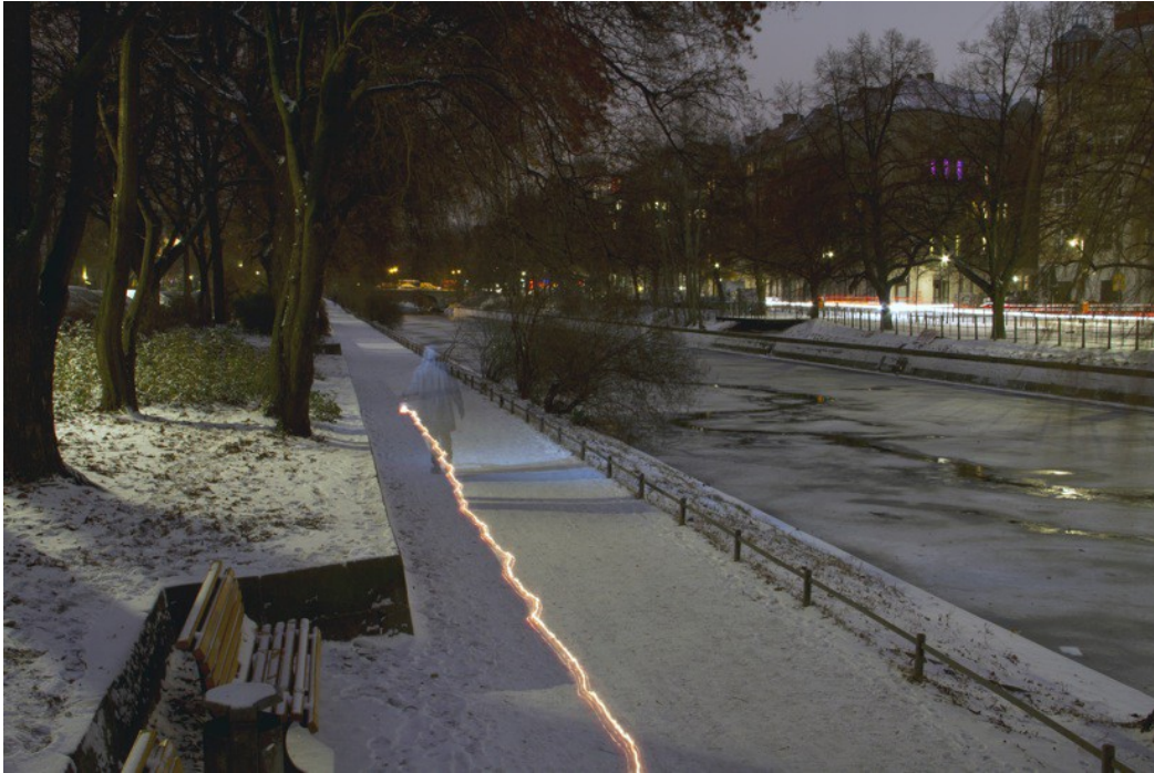
The Duration of the Present , 2013 Digital photograph 70 X 80 cm