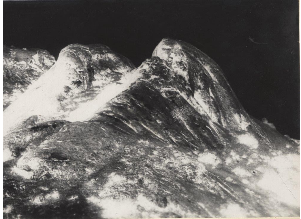
Fotografías Archival Inkjet Print sobre papel de algodón enmarcadas en vitrina procedentes del archivo de Daniel Ruzo. Medidas 70 x 89 cm