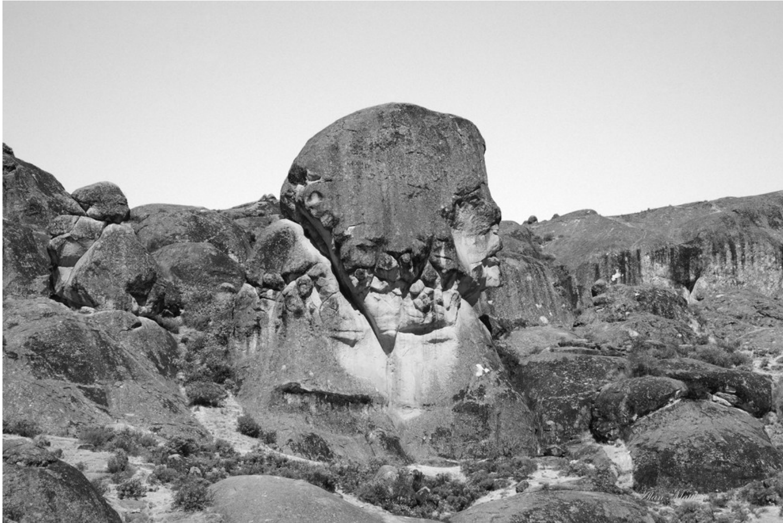
La Segunda y Media Dimensión_Una expedición a la meseta fotográfica, 2010. Wallpaper de medidades variables.