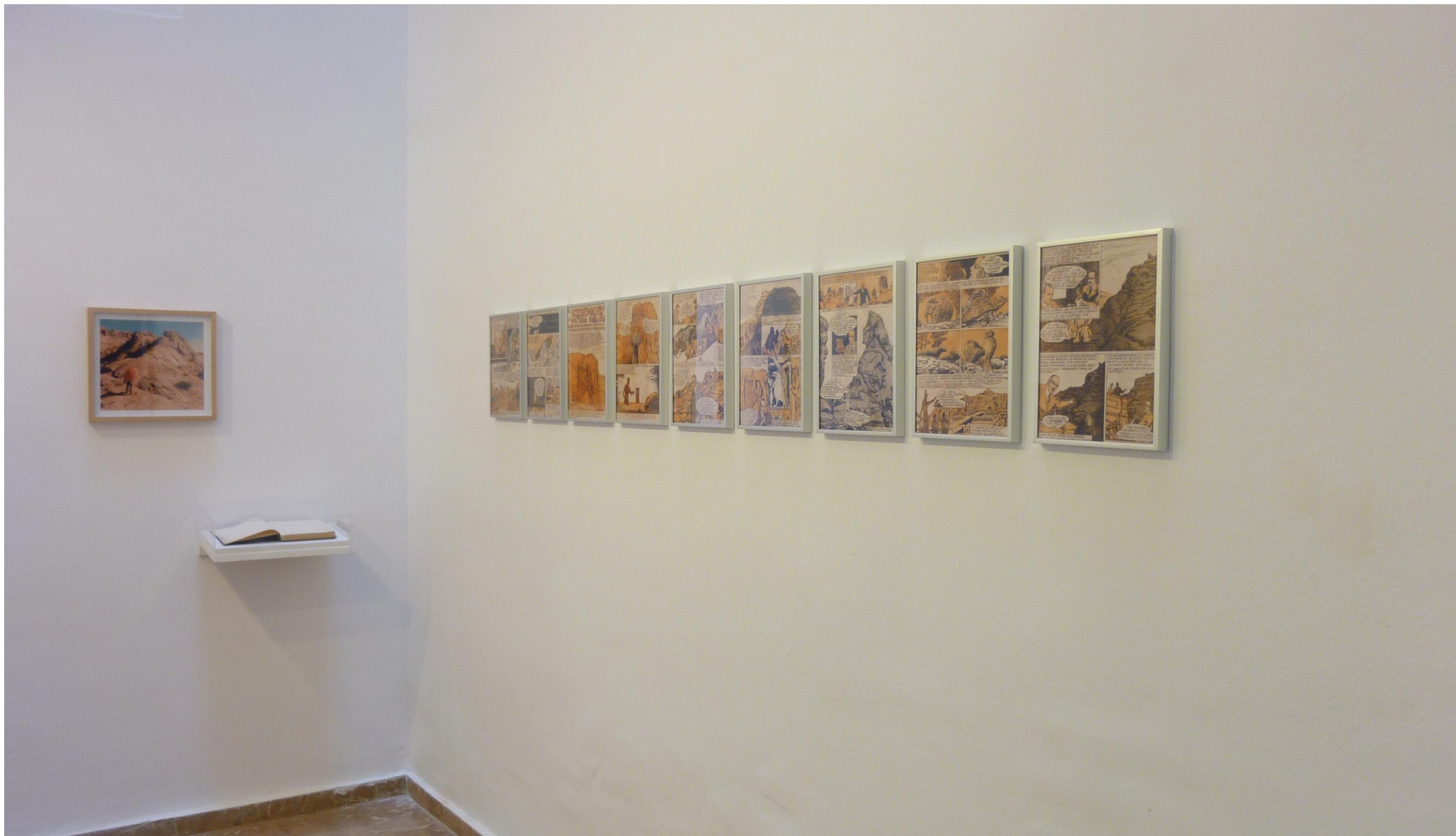
La Segunda y Media Dimensión_Una expedición a la meseta fotográfica, 2010. Instalación

Alarcón Criado. C. Velarde, 9. 41001. Sevilla. +34 954 22 16 13. www.alarconcriado.com