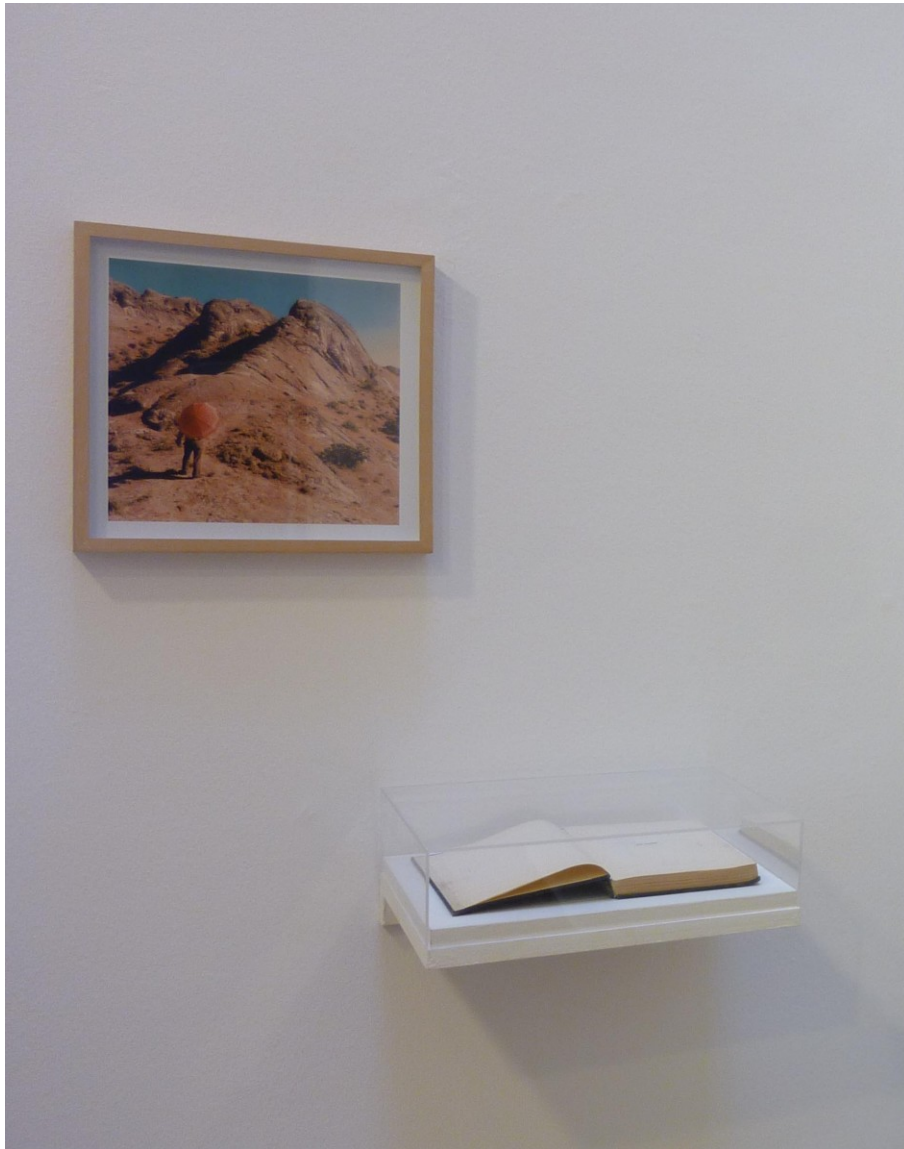
Fotografía Archival Inkjet Print sobre papel baritado en vitrina de 35 x 37 cm. Vitrina con libro de Pedro Astete Los Signos , edición original del año 1953.