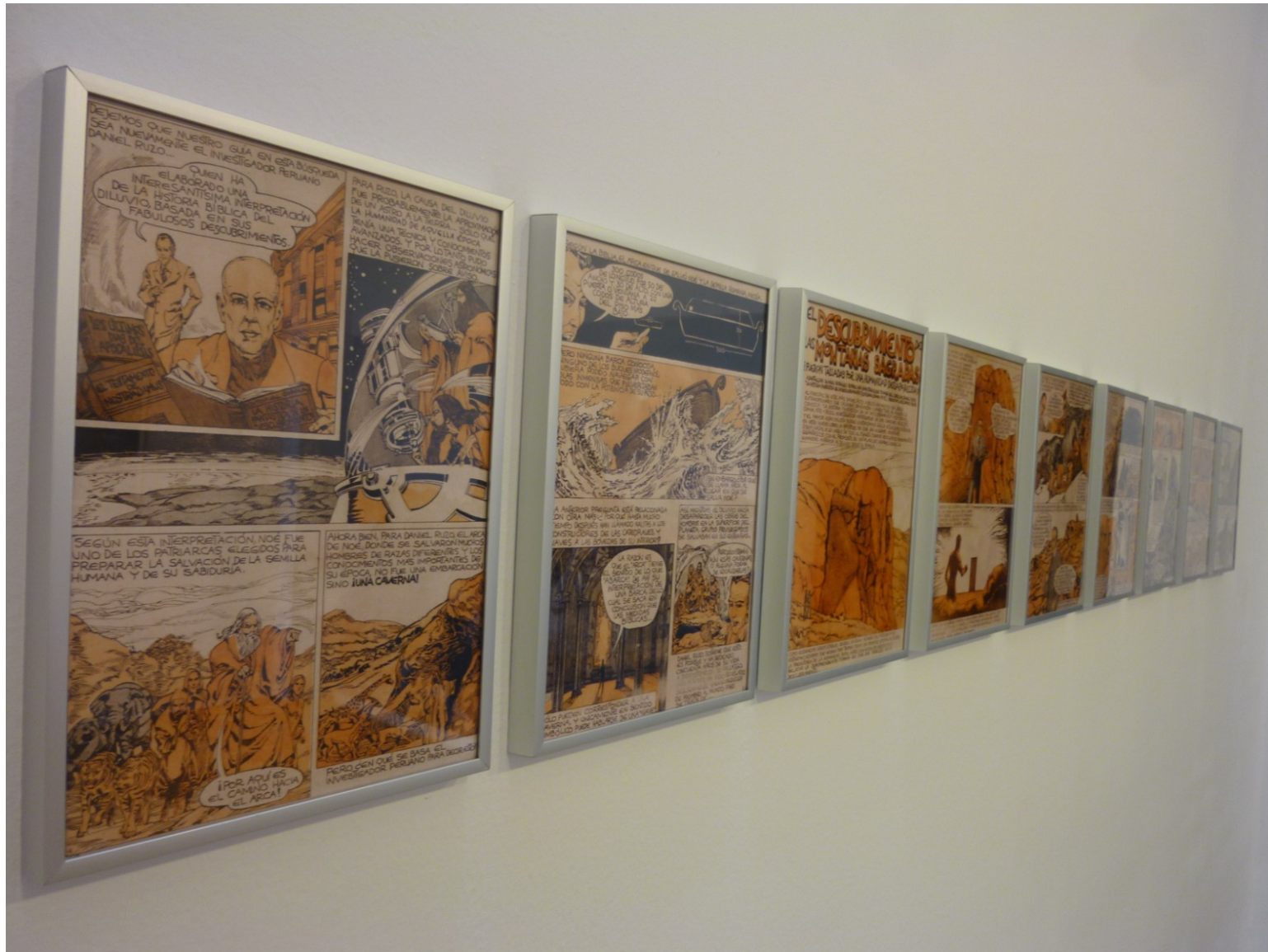
Nueve Copias Facsímiles de comics extraídos de una publicación de los años 60 procedentes del archivo de Daniel Ruzo de medidas 21 x 31 cm.