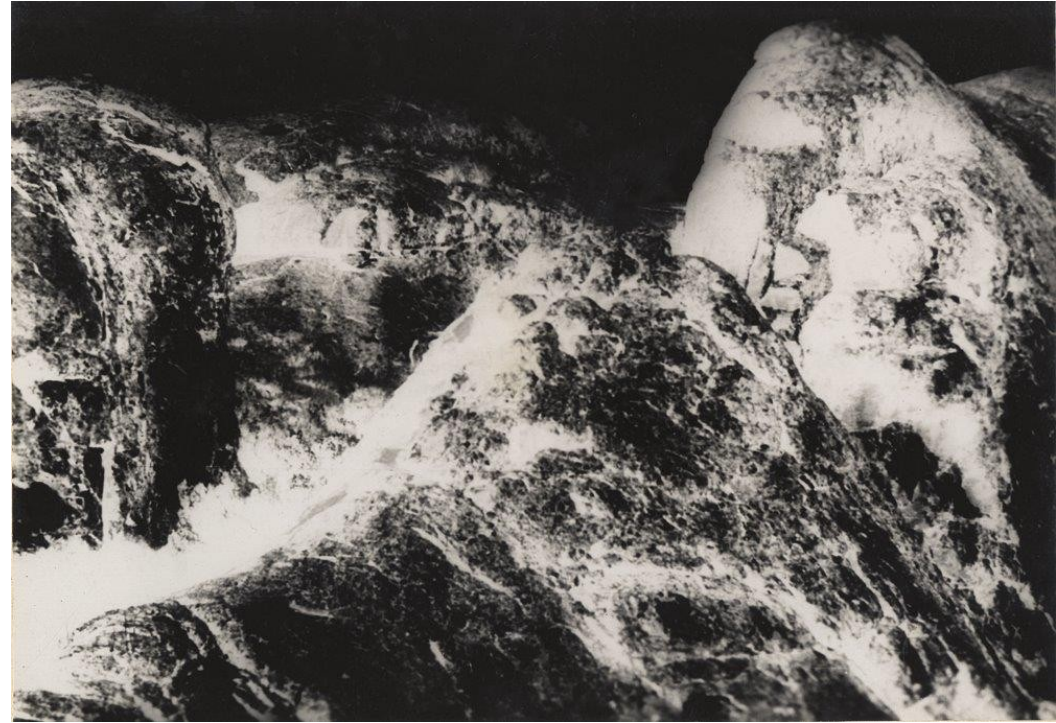
Fotografías Archival Inkjet Print sobre papel de algodón enmarcadas en vitrina procedentes del archivo de Daniel Ruzo. Medidas 70 x 89 cm