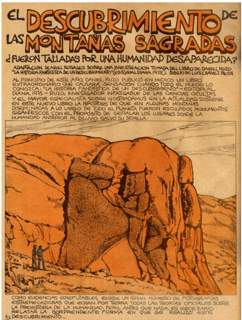
Copias Facsímiles de comics extraidos de una publicación de los años 60 procedentes del archivo de Daniel Ruzo de medidas 21 x 31 cm cada uno