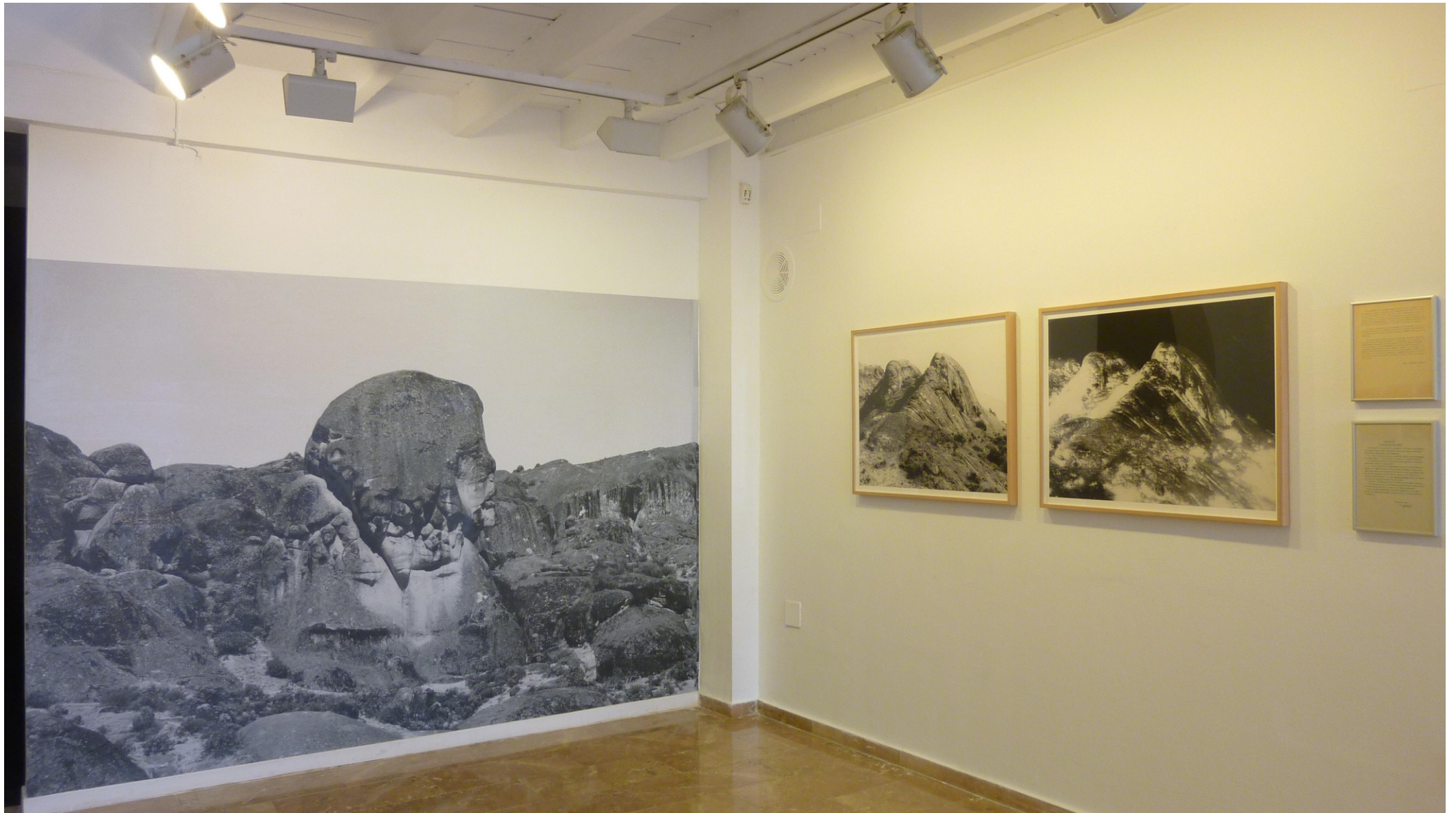
La Segunda y Media Dimensión_Una expedición a la meseta fotográfica, 2010. Instalación