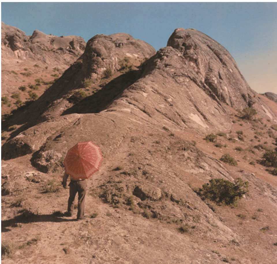
Fotografía Archival Inkjet Print sobre papel baritado en vitrina de 35 x 37 cm.