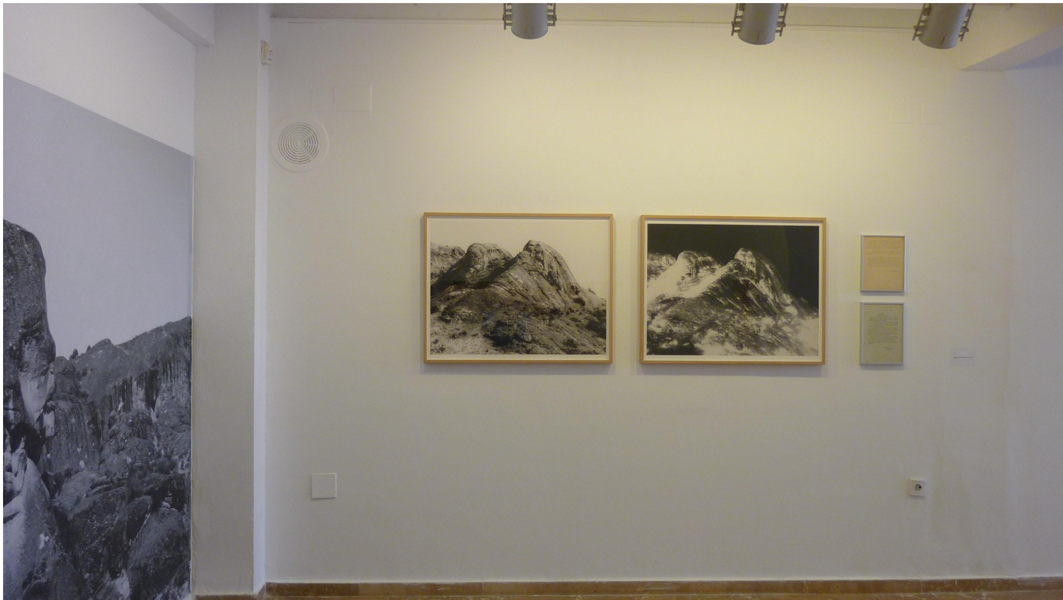
La Segunda y Media Dimensión_Una expedición a la meseta fotográfica, 2010. Instalación